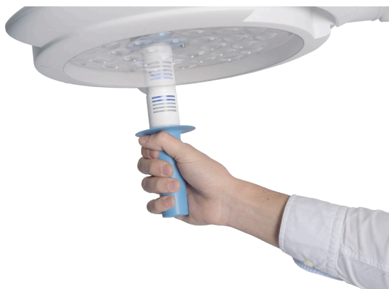
Intensidad regulable mediante el giro de la empuñadura.