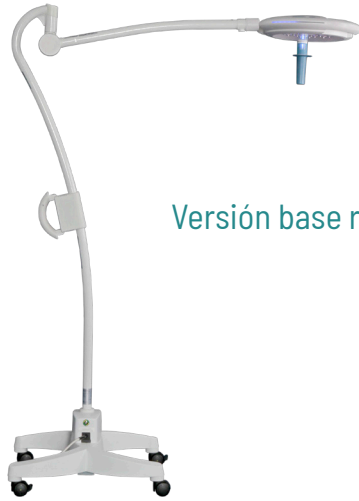
Versión base rodable.